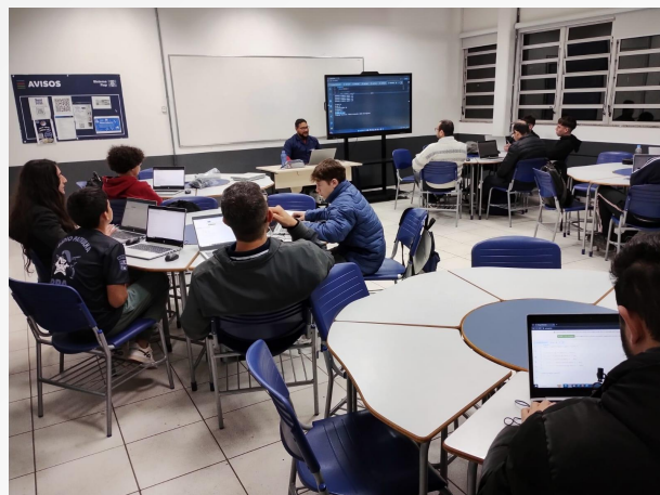
Programador de Sistemas Pato Branco