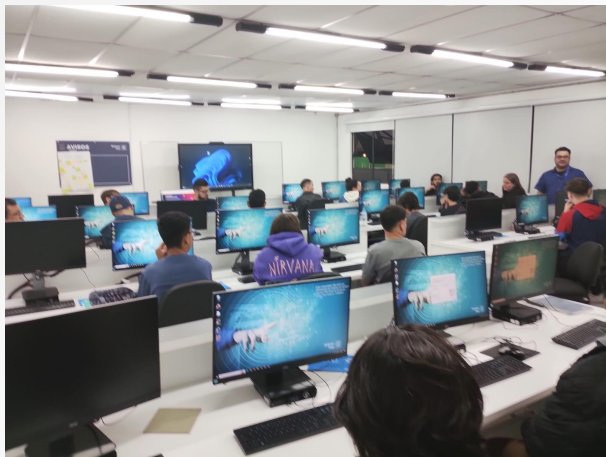
Técnico em Desenvolvimento de Sistemas Pato Branco