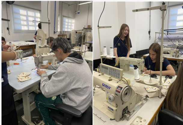
Confecção de Acessórios para cozinha Ampére