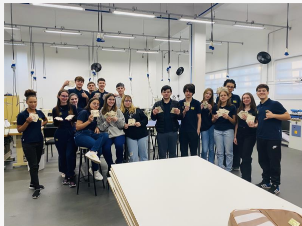
Confecção de Acessórios para cozinha Ampére